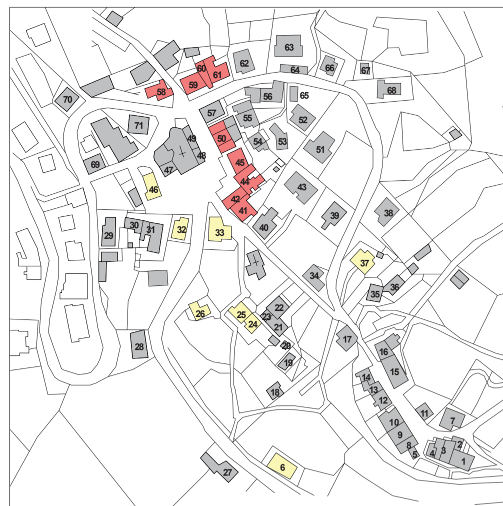
PIANO DEL COLORE - VERSIONE COMPLETA